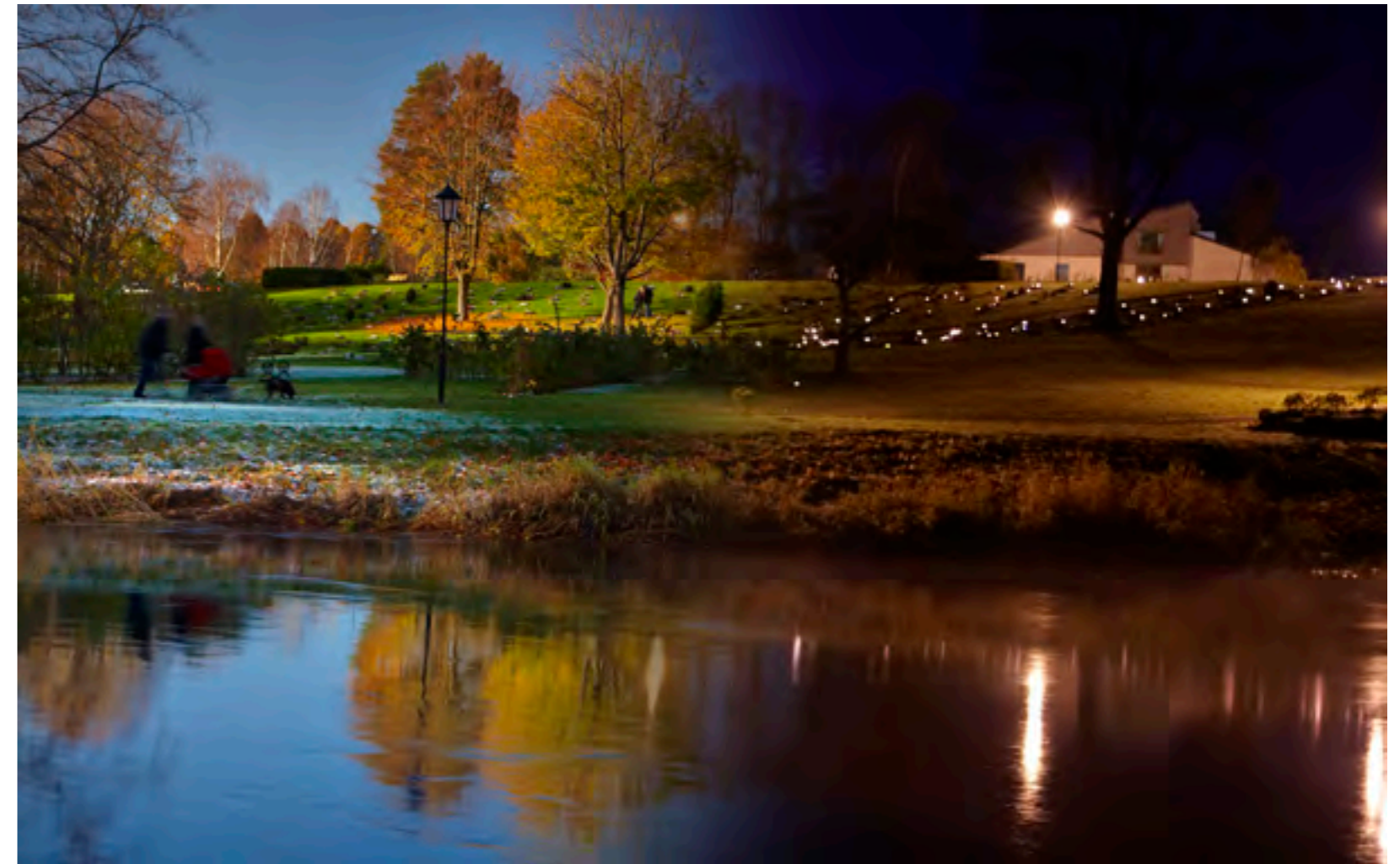
Lerums kyrkogård En allhelgonadag och kväll.